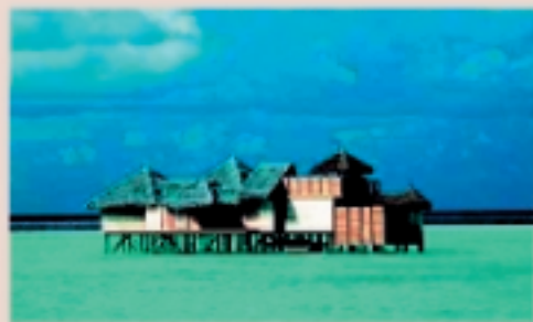
Travel Advisors Guild

absolutamente todo y aunque la sociedad internacional se ha volcado, restablecer la normalidad será difícil y largo. Hay que dar tiempo para cerrar la heridas físicas y mentales que han dejado en los habitantes víctimas del desastre. Deseamos, de todo corazón, que los ciudadanos de aquellas latitudes se repongan pronto y puedan volver a la normalidad, son personas voluntariosas, cordiales y trabajadoras que cuando hemos tenido la suerte de vivir temporalmente entre ellos nos han dado mucho; porque siempre lo hacen, son hospitalarios, muy amables, con su sonrisa a punto, en un entorno maravilloso, de ensueño, paradisíaco, con clima templado y agradable. Desde estas modestas páginas queremos rendir un sentido homenaje a todas las víctimas y extendemos, en el recuerdo, a su sacrificado espíritu al servicio de sus huéspedes.